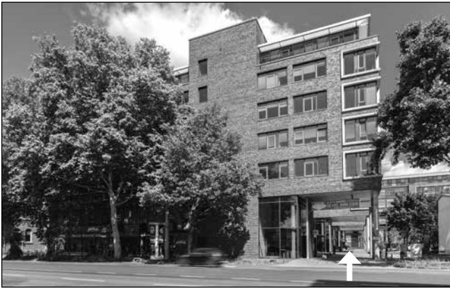
Gebäudeansicht (Zugang / Zufahrt von der Hanauer Landstraße)

Nach Zugang / Zufahrt auf das Gelände folgen Sie bitte als Fußgänger der Ausschilderung ins Gebäude bzw. mit dem Auto der Ausschilderung zur Tiefgarage. Besucherparkplätze stehen in Ebene -1, Bereich A (gelb) und B (rot) zur Verfügung. Der Gebäudezugang von der Tiefgarage erfolgt über den ausgeschilderten Eingang 291.